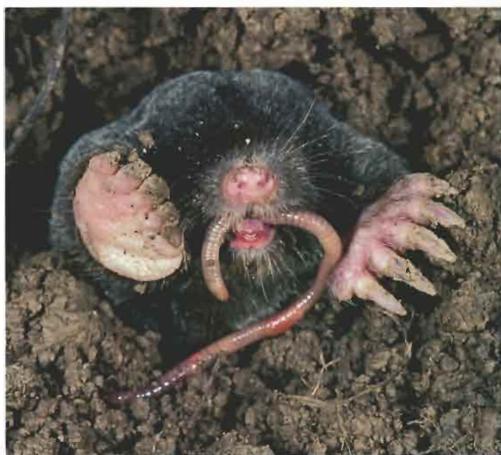
La taupe fait une réserve de vers de terre vivants ! Elle les mord pour les empêcher de bouger, puis les laisse dans une galerie.