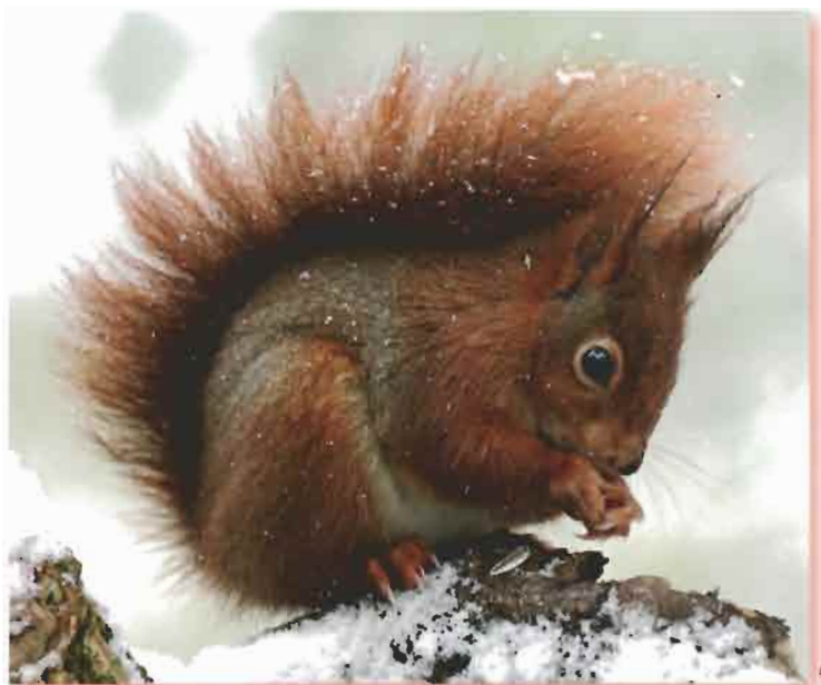
L'écureuil cache des glands partout dans la forêt. Mais il ne les retrouve pas toujours... Oups !

C'est fatigant de lutter contre le froid ! Les animaux ont besoin de manger pour reprendre des forces. Mais, en hiver, il n'y a plus de fruits ni de feuilles, et l'herbe est couverte de neige... Alors, les plus rusés font des réserves dès l'automne. Le chevreuil fabrique son manteau de graisse et d'autres, comme l'écureuil ou le blaireau, mettent de la nourriture dans des cachettes.