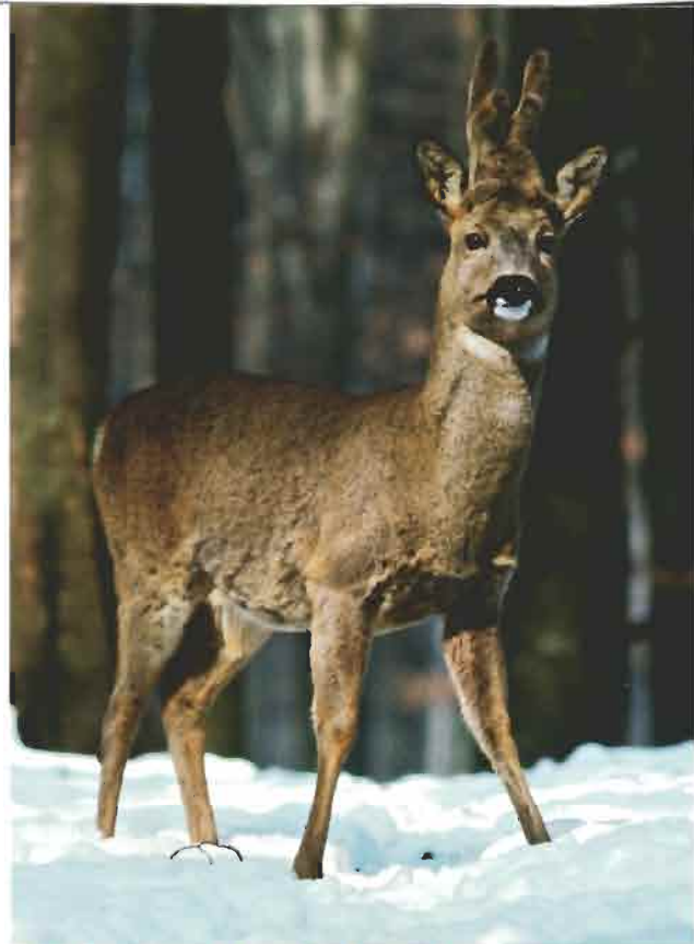
Quel gourmand ! Plus le chevreuil sera gros, plus il aura chaud.