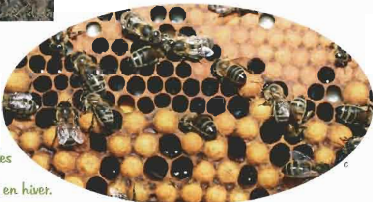
Regarde : les abeilles rangent leur miel. Elles le mangeront en hiver.