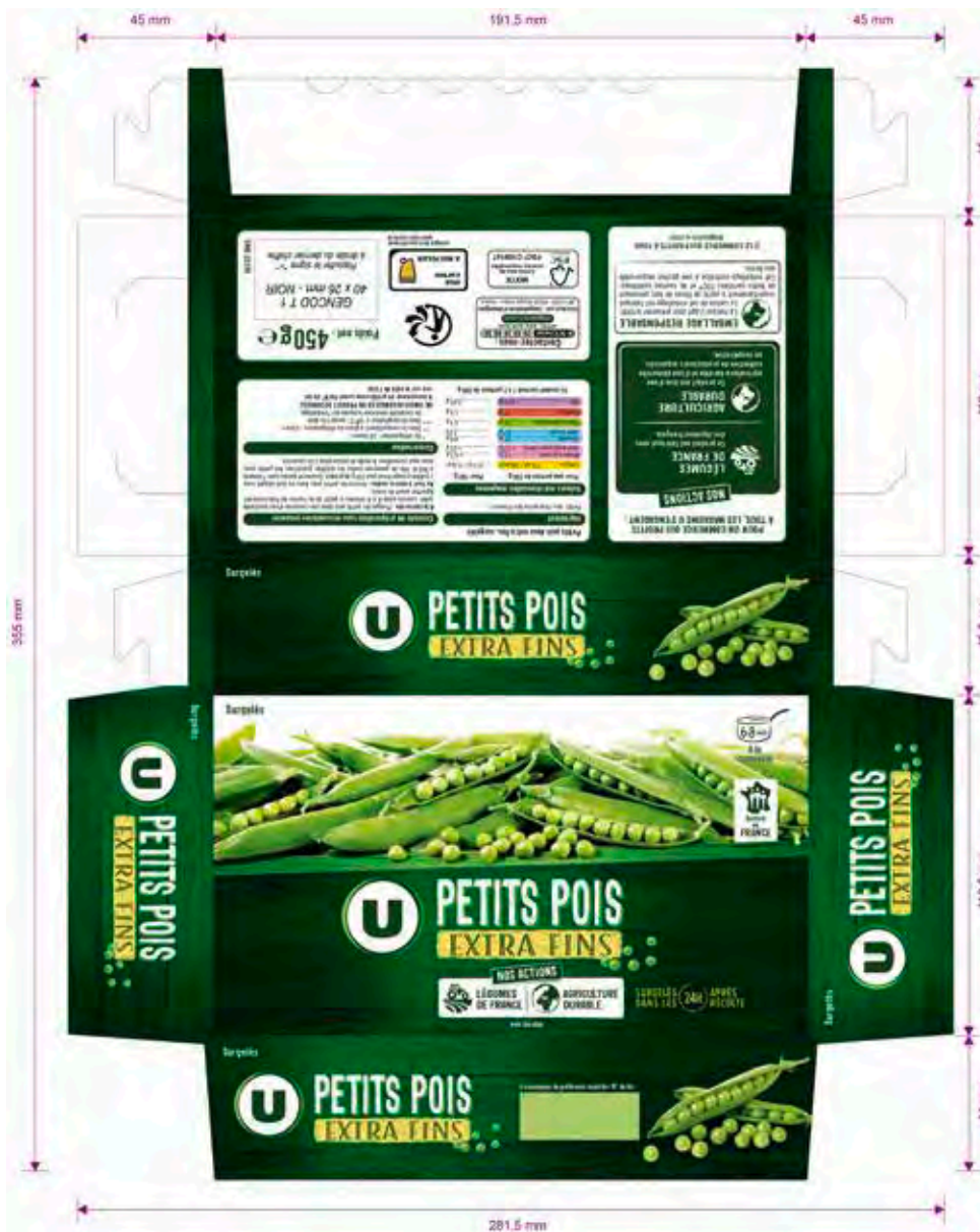
Support Carton Offset