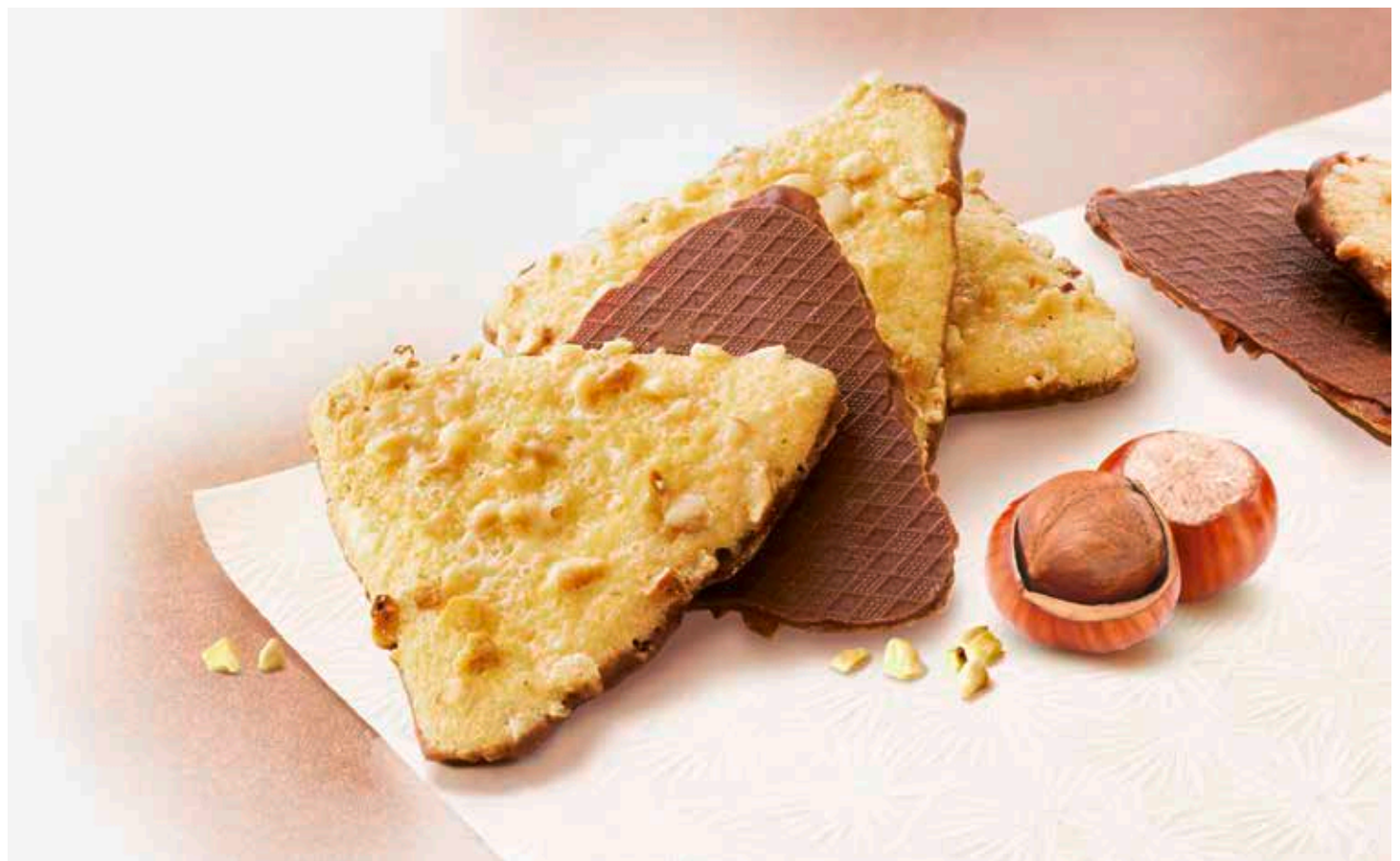
Montage, retouches et colorimétrie pour facing de packaging.