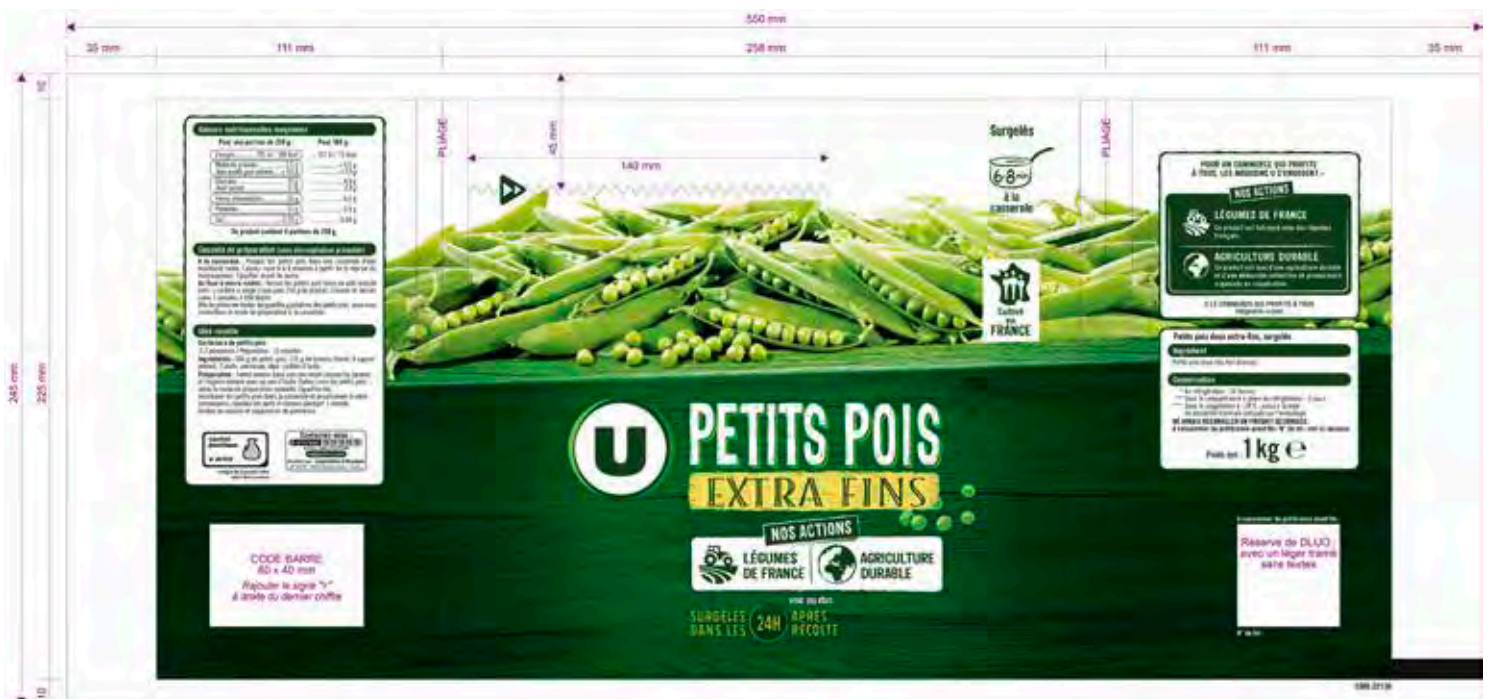
Support Film Plastique Flexographie

Développement, mise au point, retouche visuels et exécution packaging alimentaire, mise au normes Inco, Offset et Flexographie