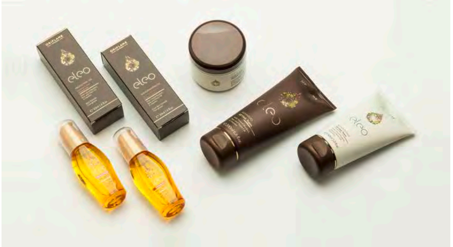
Raw brut de prise de vue