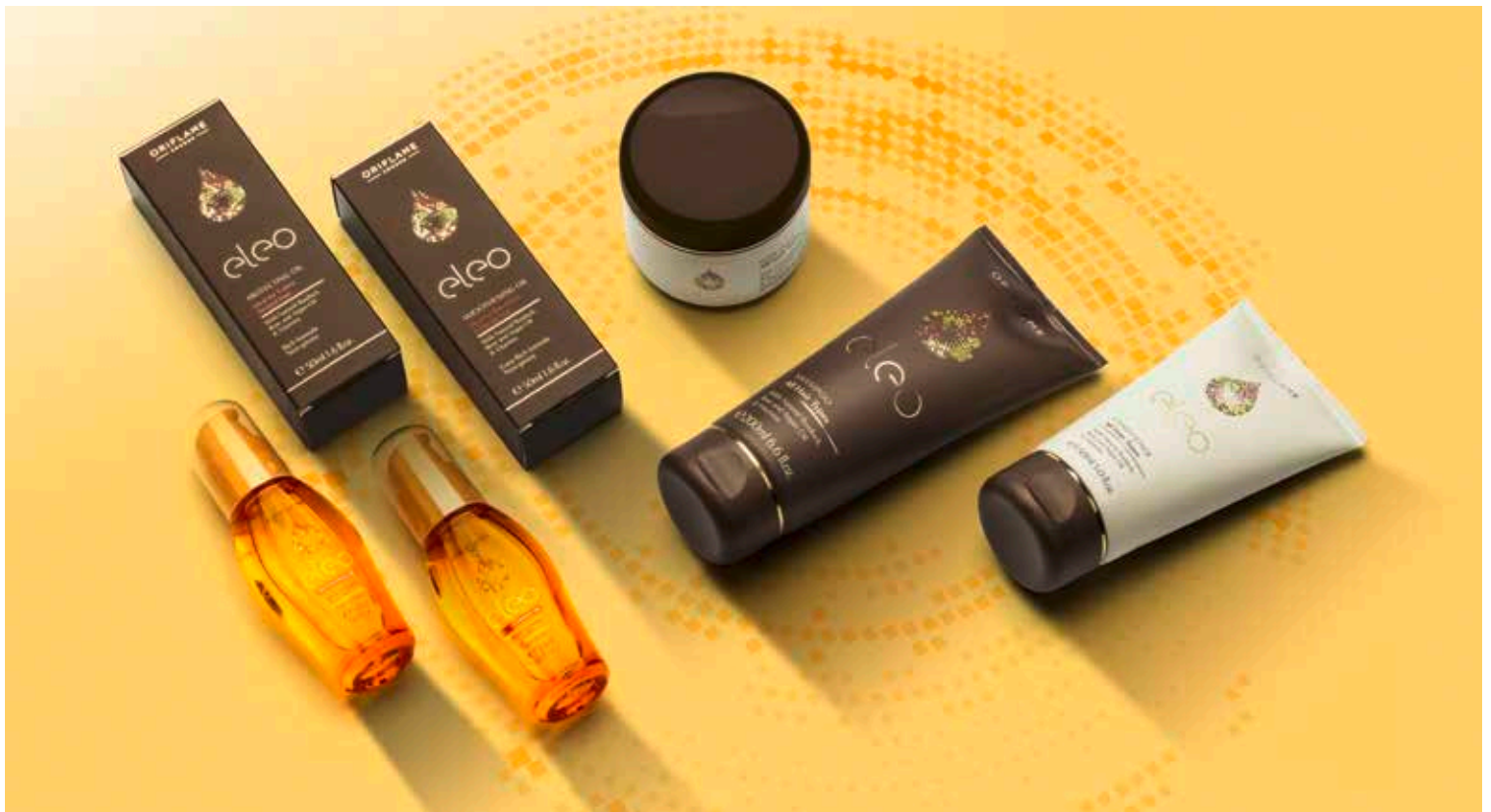
Développement Raw, photomontage, retouches et colorimétrie