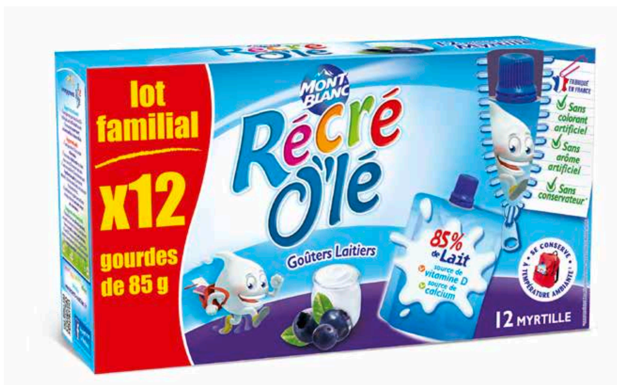
Fausse 3D réalisée à partir du fichier à plat sous Photoshop