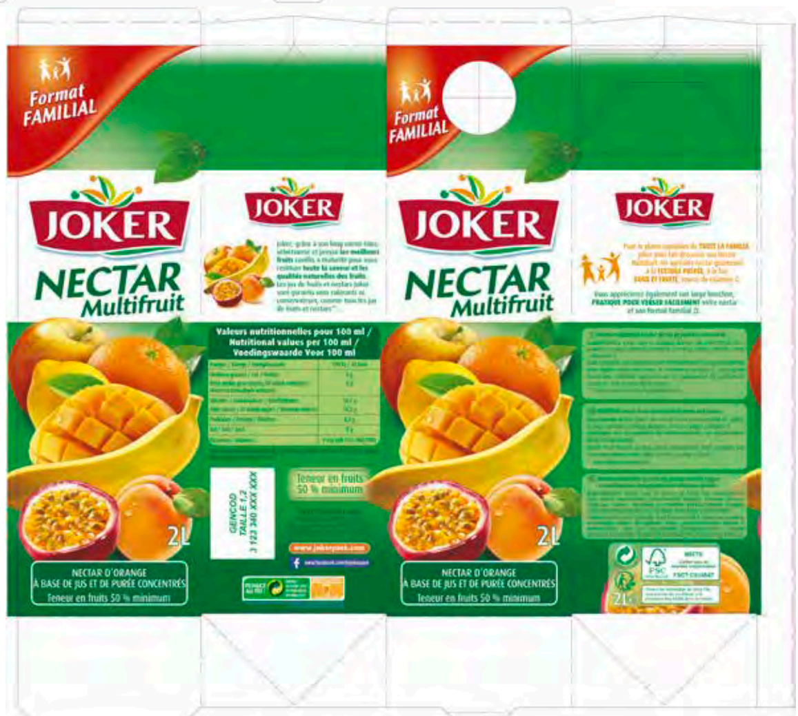
Exécution packaging alimentaire, retouche visuels, mise au normes Inco